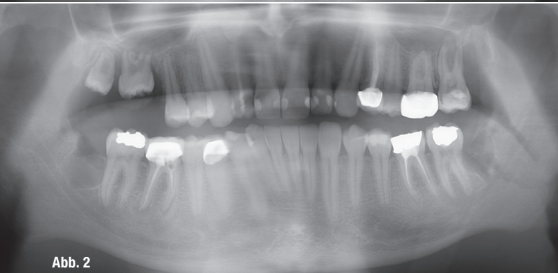
Patientenfall 1 – Abb. 1: Präoperatives OPG. Abb. 2: Postoperatives OPG.